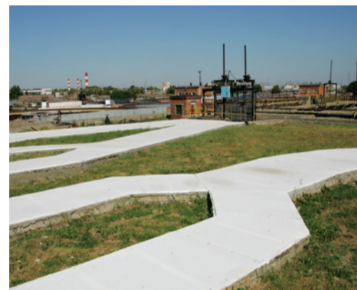
Перекрытия на подводящих каналах