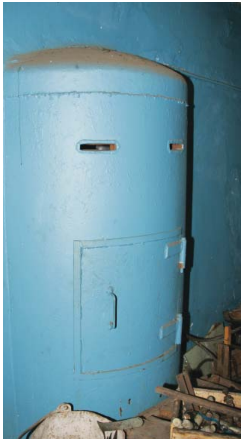
Бункер на Рублевской станции водоподготовки.